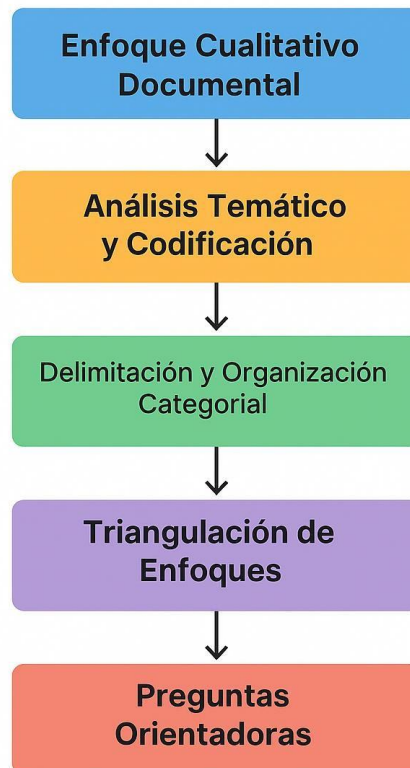
Figura 3. Diagrama de Flujo Metodológico

El proceso de análisis incluyó una etapa inicial de delimitación conceptual, en la que se identificaron categorías claves como: educación energética, innovación social, transición justa, participación comunitaria, tecnologías renovables, educación transformadora, políticas públicas integradas y sostenibilidad territorial. Posteriormente, estas categorías fueron organizadas en una matriz comparativa de enfoques y sistematizadas en un mapa relacional de actores y dimensiones, con el objetivo de visualizar las interacciones y tensiones entre los campos estudiados.